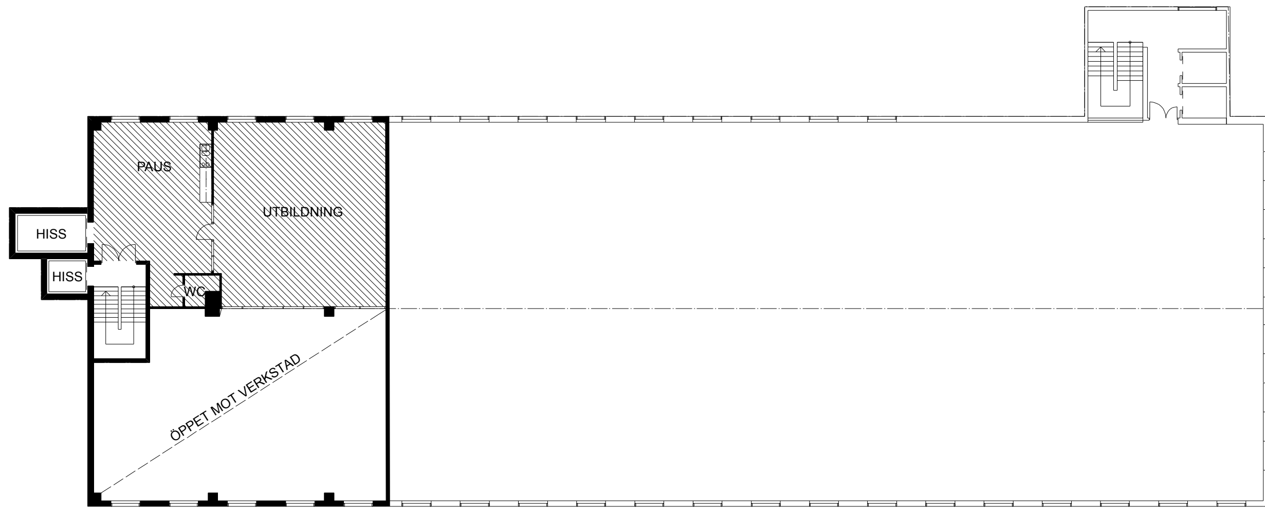
LOFTPLAN YTA~137 m 2