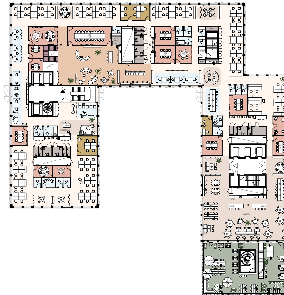
PLAN 9 - 2197 KVM