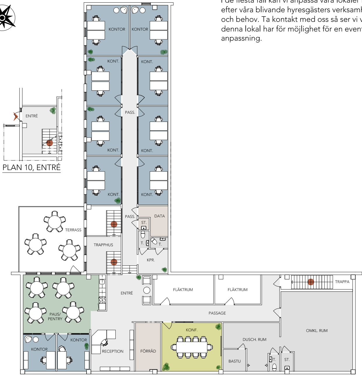
PLAN 10, ENTRÉ