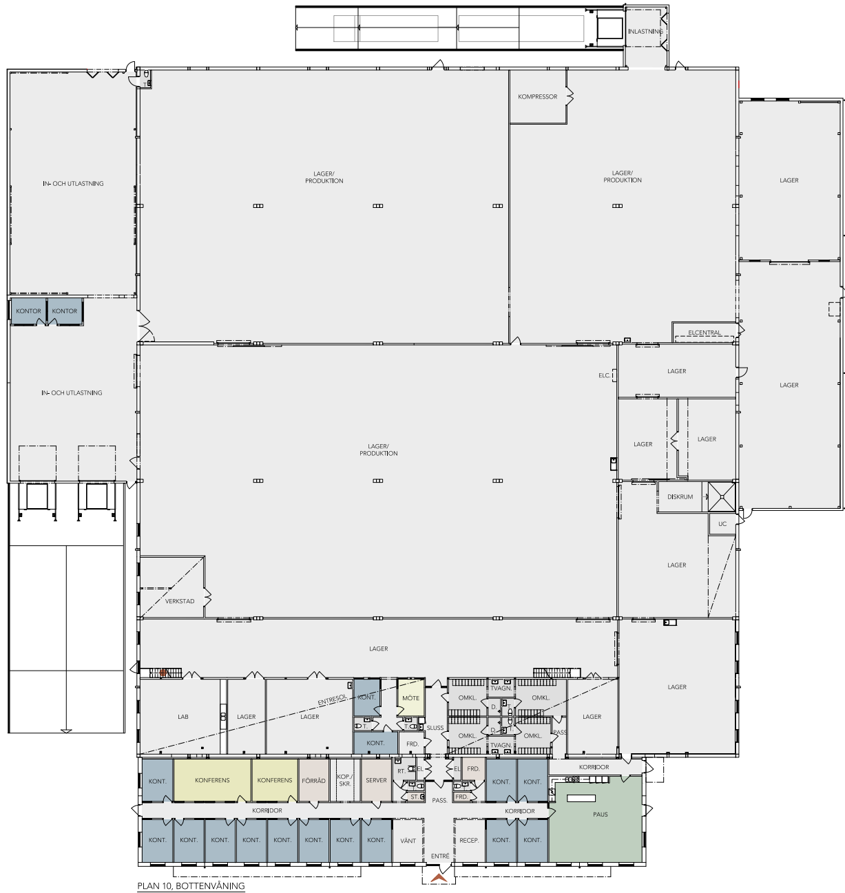
PLAN 10, BOTTENVÅNING